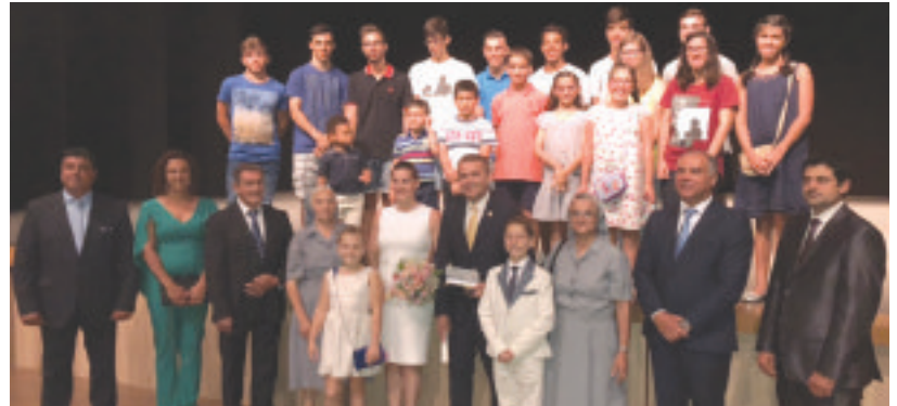
▶ Aspecto da cerimónia, vendo-se os vários convidados e crianças da Obra Social Madre Maria Clara