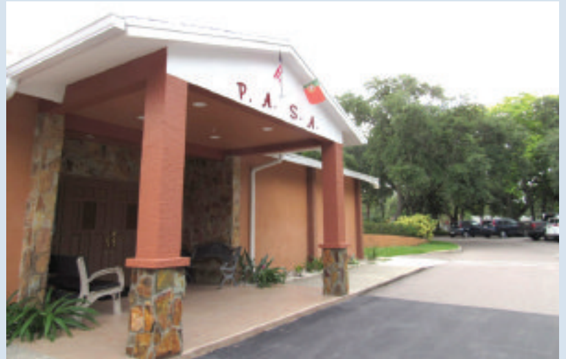
▼ A PASA continua aberta aos sábados com os seus habituais jantares - mesmo nesta altura do ano

Embora as actividades mensais estejam reduzidas no verão, o salão está aberto aos sábados para jantar para aqueles que fazem férias curtas fora e aqueles