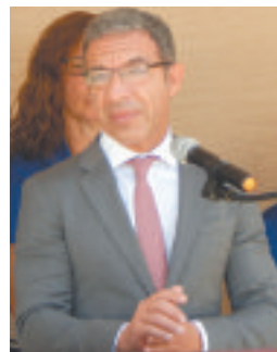
▼ O deputado Duarte Pacheco

A direcção do PACC agradece muito reconhecidamente aos voluntários que em dias de grande cansaia continuaram a fazer um trabalho excelente. Também um agradecimento especial para o tradicional e muito colorido folclore que engrandeciu o nosso dia, em especial aos ranchos 'Sonhos de Portugal' e 'Corações de Portugal'. O calor era intenso, assim como o fervor com que os elementos dos dois grupos executaram os seus números de danças, e que era puramente contagiante.