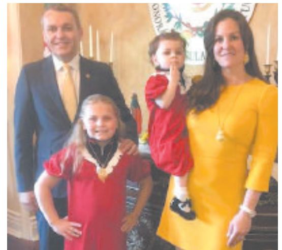
▼ O Cônsul Honorário de Portugal com a esposa e filhas na recepção na residência