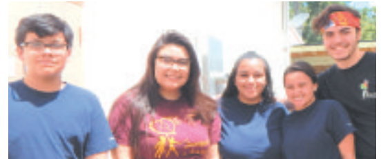
Grupo de jovens voluntários do PACC de Palm Coast