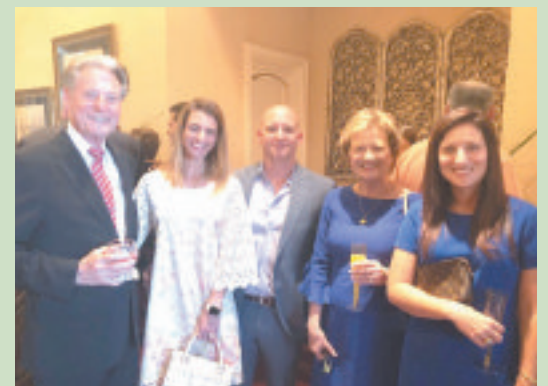
◀ Outro aspecto da recepção do Dia de Portugal na residência

Ficou a certeza de que a comunidade lusa no condado está bem de saúde e recomenda-se e de que mais do mesmo acontecerá em 2019.