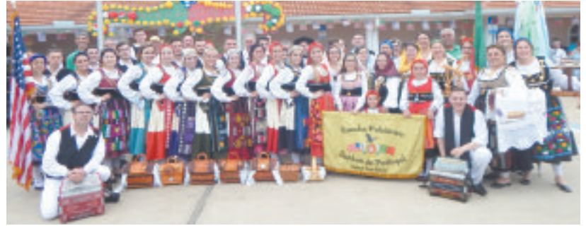
▼ O Rancho Folclórico 'Sonhos de Portugal', da Associação Portuguesa de Kearny, em Palm Coast