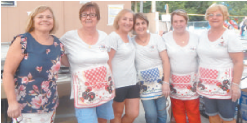
▼ Algumas das senhoras voluntárias que trabalharam para o êxito das comemorações