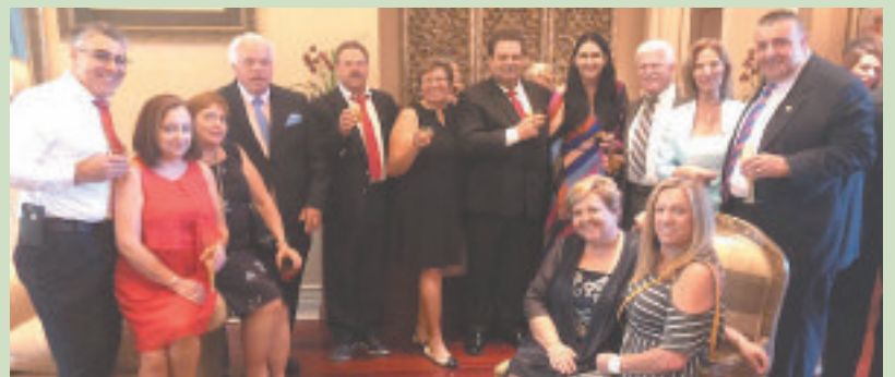
◀ Numero grupo de empresários portugueses radicados no condado de Flagler na recepção na residência