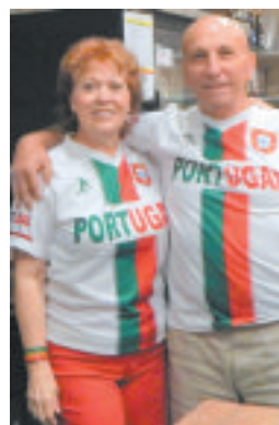
▼ Outro grupo de voluntários durante os festejos do Dia de Camões no PACC