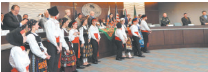
▼ Aspecto das cerimónias do Dia de Portugal na sala do Conselho Municipal de Palm Coast