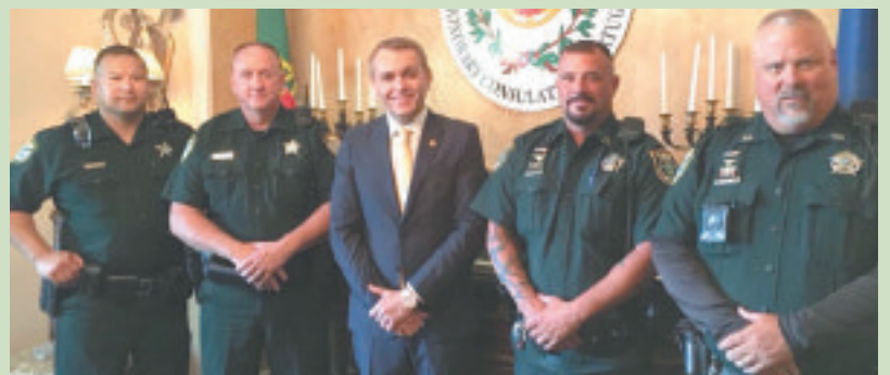
◀ O Cônsul Honorário de Portugal com agentes da lei e da ordem na recepção do Dia de Portugal na residência