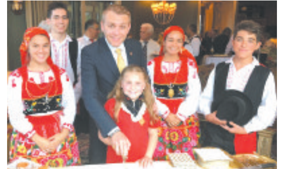
▼ O corte do bolo com elementos do 'Corações de Portugal'