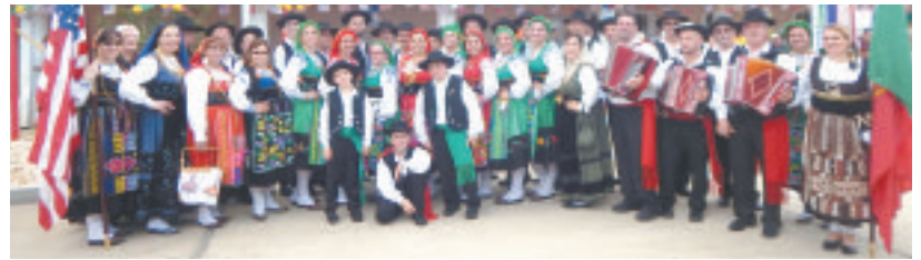
▼ O Rancho Folclórico 'Corações de Portugal', de Palm Coast, nos festejos do 10 de Junho no PACC